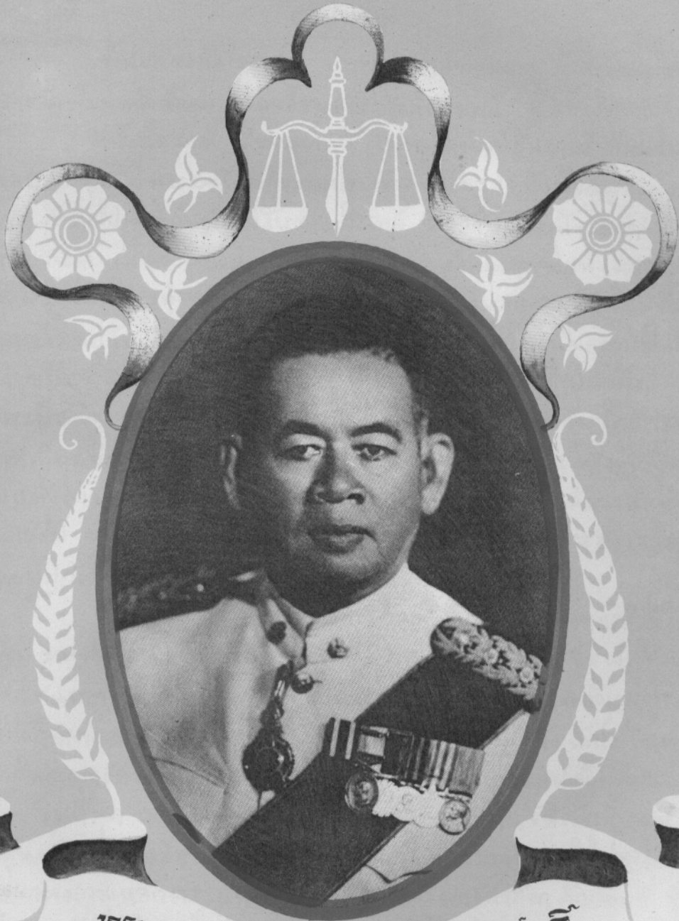
ឧបនាយករដ្ឋមន្ត្រី ឧបនាយករដ្ឋមន្ត្រី ឧបនាយករដ្ឋមន្ត្រី