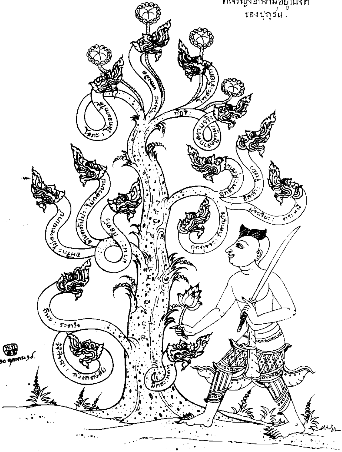
ภาพต้นไม้พิษ

มีคำอธิบายอยู่ที่ หน้า ๔๒๐, ๔๒๑, ๔๒๒, ๔๒๗