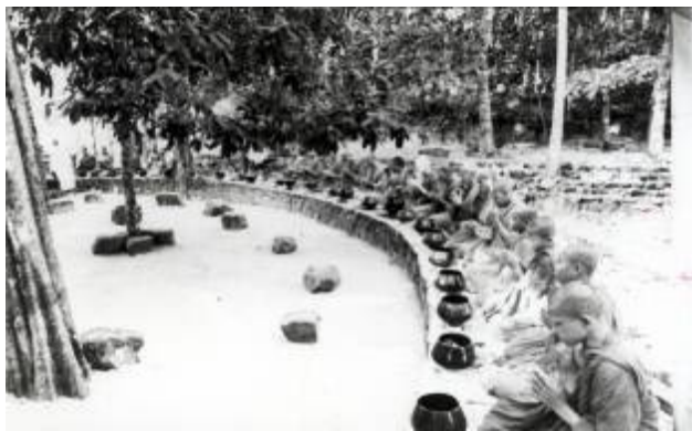
bw0363 ภาพถ่ายเดี่ยว

ลานหินโค้ง สร้างขึ้นเพื่อรองรับการเสด็จพระในสมัยพุทธกาล ที่พระสงฆ์ฉันจังหันบนพื้นดิน ลานหินโค้งจึงเป็นจุดกำเนิด ประเพณีตักบาตรสาธิต “ความคิดเรื่องหินโค้งก็ค่อย ๆ เข้ามา จำไม่ได้แล้วว่าความคิดฟักตัวขึ้นอย่างไร แต่เราชอบโค้ง พระจันทร์ครึ่งซีก มันสวยกว่าเป็นศิลปะกว่าที่อื่น ๆ แล้วก็สะดวก ประธานสงฆ์นั่งตรงกลางสามารถเห็นองค์อื่น ๆ หมด”