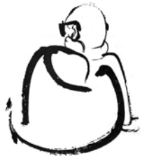
ภาพท่านอาจารย์พุทธทาส โดย โกวิน เอนกชัย (เขมานันทะ)