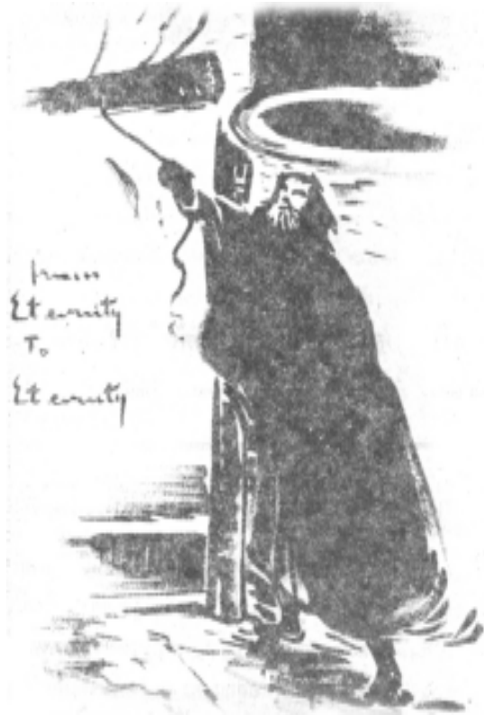
“จากอนันตะสู่อันันตะ” โดย เอ็มมานูเอล เซอร์แมน