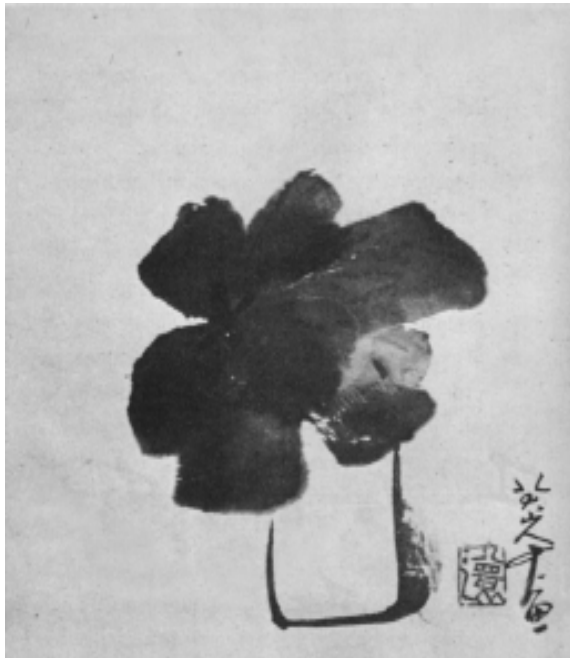
“ดอกไม้ในแจกัน” โดย ป้าต้าชานเยิ่น