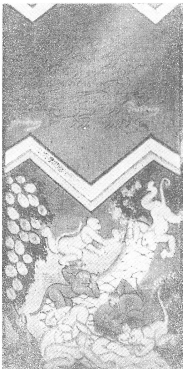
เรื่อง ติงพระโพธิสัตว์