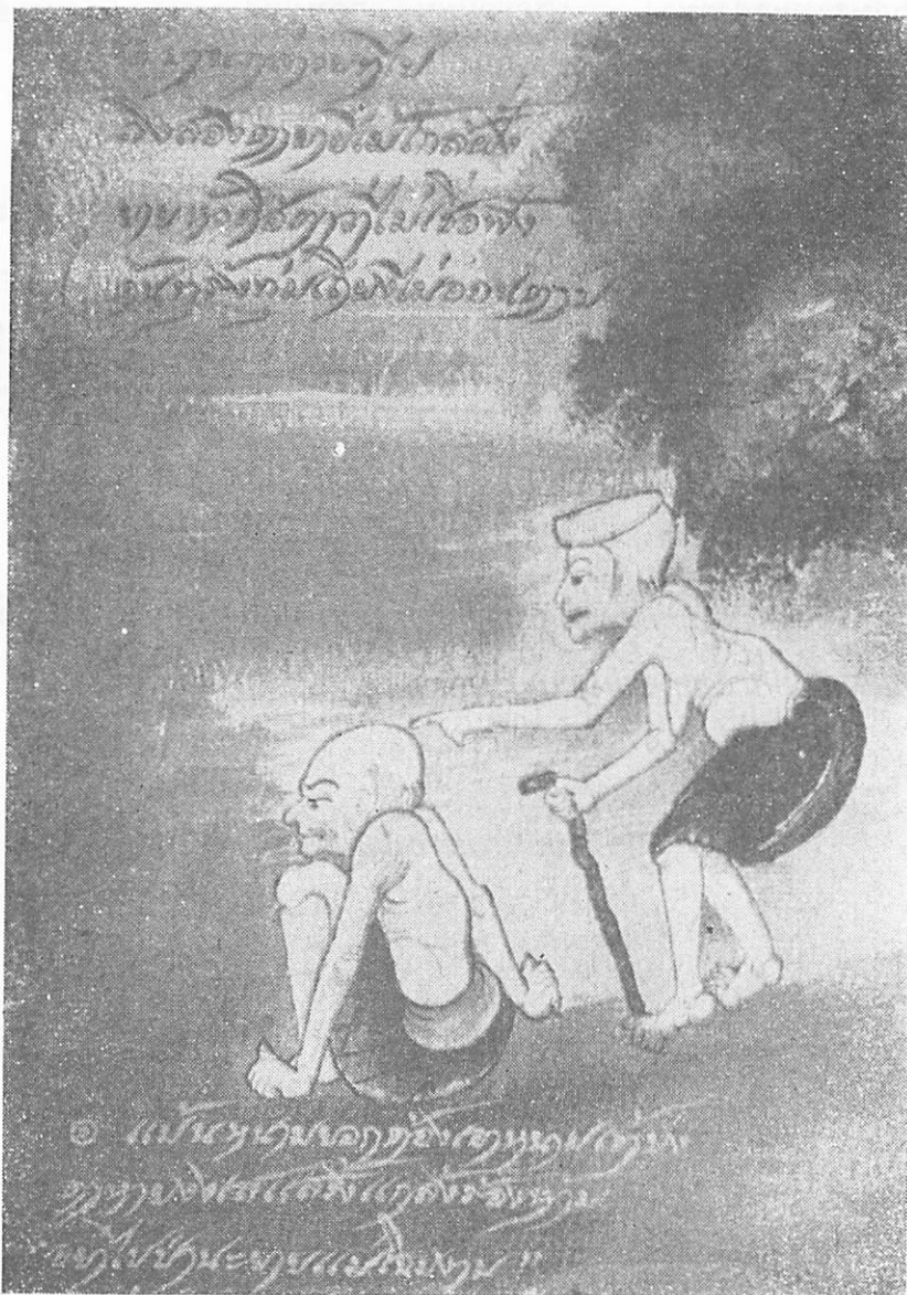
๕ เรื่อง ยายกะตา กับ นามนต ๕๖๗