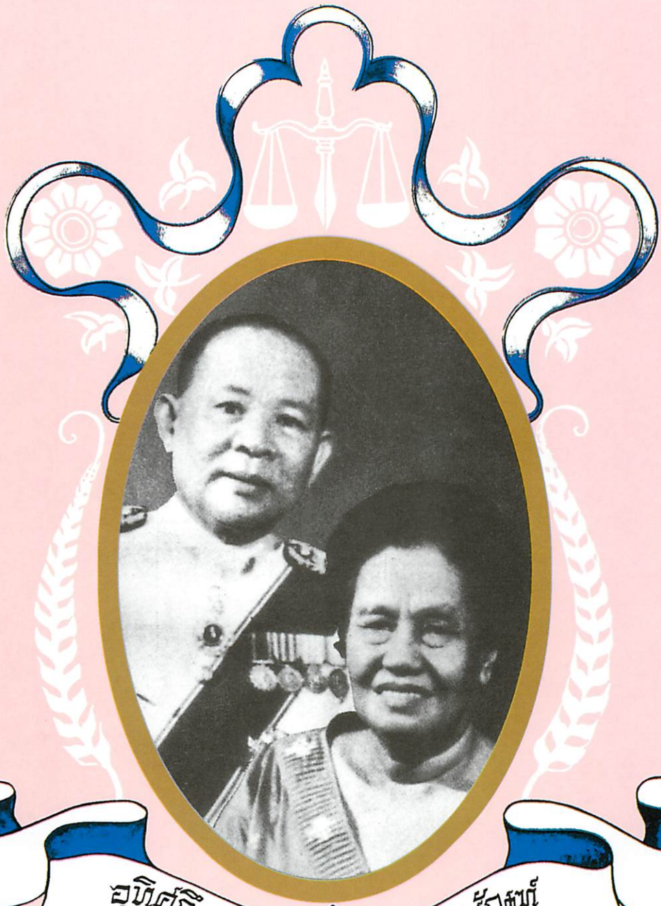
គុហិក្រិវិង បរមតុល្យបរាភ័ស្ត្រស័ង្សវិស័យ នៃសេដ្ឋកិច្ចសាម ប៊ិកស្តីវិស័យ