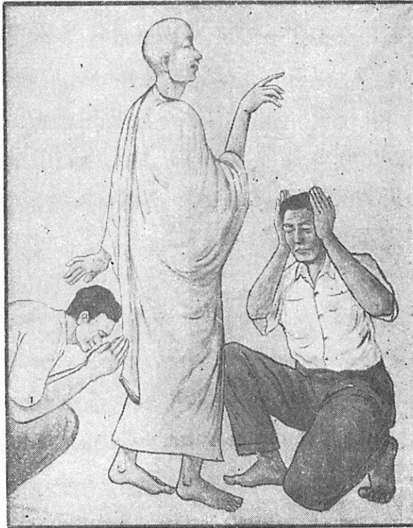
สมณีนั้พวกเราเอาแต่ไหว้ พอบอกให้ประพฤติธรรมก็กำหนู.

อาตมาขอจบคำกล่าวนี้ ในฐานะเป็นการปิดการประชุมเพียงเท่านี้ และขอกล่าวคำสวัสดิ์แก่ท่านทั้งหลายทุกคนด้วยเทอญ.